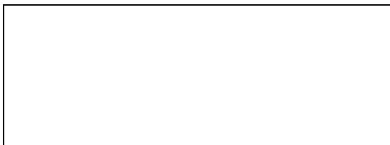
JAIME JUNIOR FERENS Engenheiro Civil - CREA/SC 204919-0