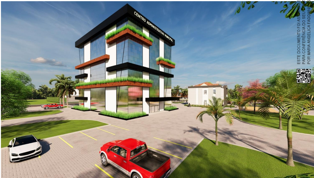
14.2. PROJETOS DE MODELAGEM 3D