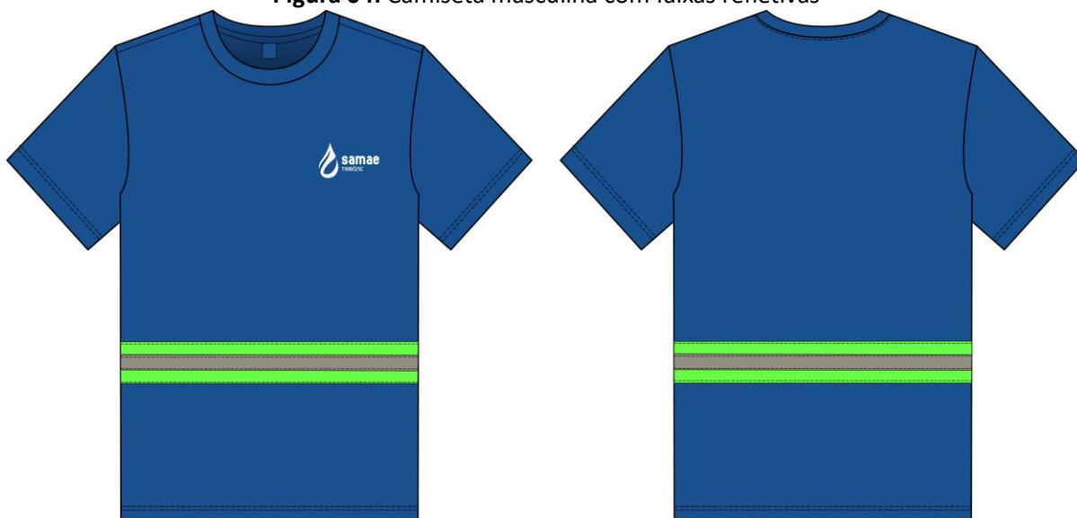
Figura 04: Camiseta masculina com faixas refletivas

A barra do corpo e das mangas deverão possuir 2,5 cm de largura costuradas com máquina galoneira de 2 (duas) agulhas com 4 pontos p/cm bitola 6,4 mm.