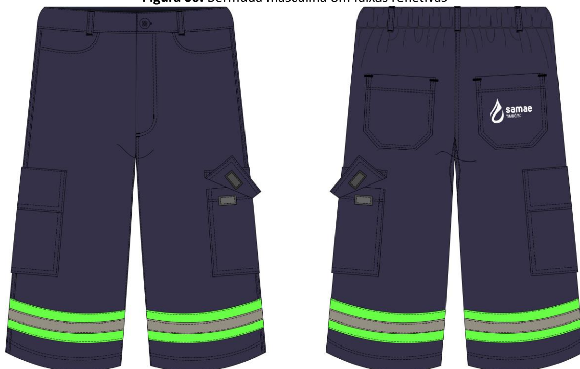
Figura 06: Bermuda masculina om faixas refletivas

Montagem da peça: A calça deve ser confeccionada no seu fechamento lateral na máquina Interlock e rebatida na de braço duas agulhas bitola 6,4mm e o fechamento entre perna na máquina Interlock. A linha utilizada para a confecção da calça é a linha de pesponto – 80 e a cor é no tom da peça. Montar os bolsos traseiros em máquina reta de 2 agulhas, bainha da calça é barra lenço de 2 cm em máquina reta 2 agulhas bitola de 0,7 cm.