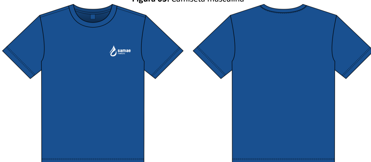
Figura 03: Camiseta masculina

A barra do corpo e das mangas deverão pussuir 2,5 cm de largura costuradas com máquina galoneira de 2 (duas) agulhas com 4 pontos p/cm bitola 6,4 mm.