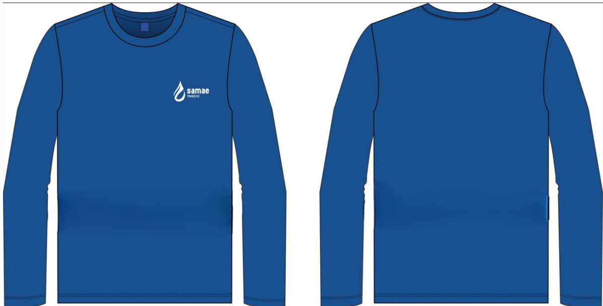
Figura 01: Camiseta masculina manga longa

A barra do corpo e das mangas deverão possuir 2,5 cm de largura costuradas com máquina galoneira de 2 (duas) agulhas com 4 pontos p/cm bitola 6,4 mm.